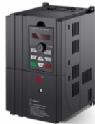
BD600系列高性能矢量变频器