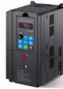
BD330系列高性能矢量变频器