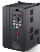
BD600系列高性能矢量变频器