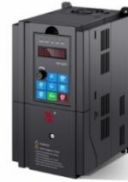
BD330系列高性能矢量变频器